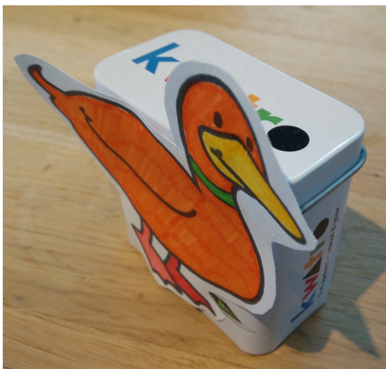
Stap 5: bevestig de afbeelding aan een blokje of Duplo, eventueel kan je voor 2 duploblokken op elkaar kiezen.