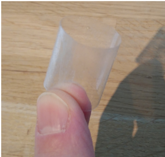
Stap 3: Maak dubbelzijdig plakband door een stukje plakband met de plakzijde naar buiten in een rondje te plakken.