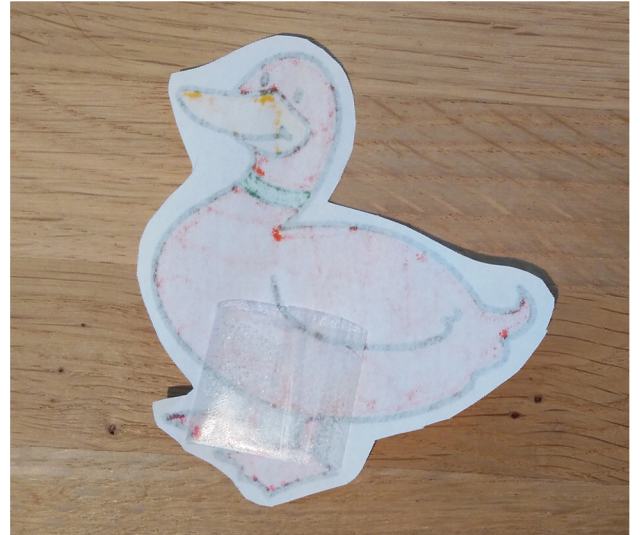
Stap 4: Plak het 'dubbelzijdige' plakband achterop en een beetje onderaan de afbeelding.